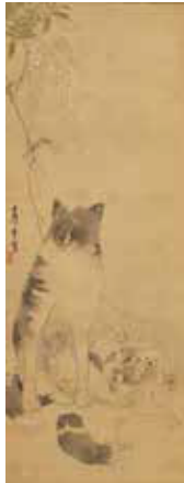
長沢芦雪 「親子犬図」 個人蔵