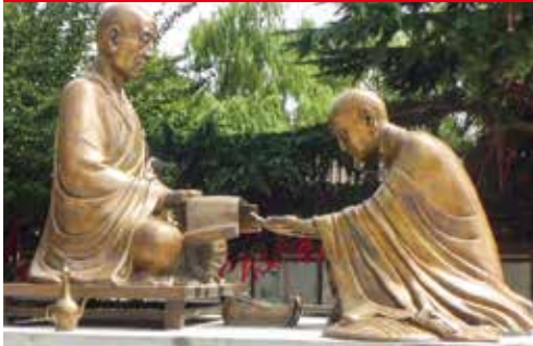
写真 西安市青龍寺(空海が入唐し学んだ寺) *空海長安紀行ツアー時のものです。