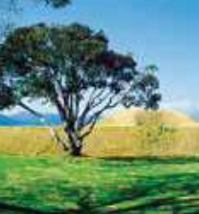
江田神社 (イザナギ禊の池)