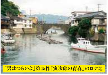
「男はつらいよ」第45作「寅次郎の青春」のロケ地

伊東氏5万1千石の居城。「と称され石垣や蔵、商人通り、武家屋敷通りなど風情と情緒のある城下町として知られています。