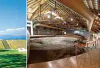
日南海岸 フェミックスロード

東西2.6km、南北4.2km(大阪ドームの約230倍の面積)の台地上に300基以上の古墳が点在し、そのほとんどはまだまだ発掘されないまま、自然の状態にて保存されています。