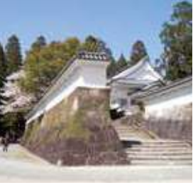
日本百名城 飢肥城～九州の小京都～