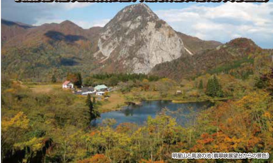
明星山と高浪の池(翡翠峡展望台からの景色)