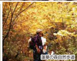
蓮華の森自然歩道