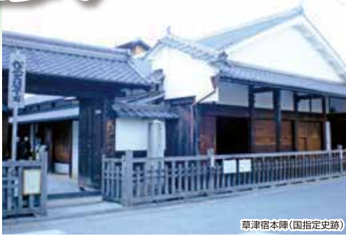
草津宿本陣(国指定史跡)

京の都から歩き出した東海道。滋賀県近江の国と三重県伊勢国との境には、難所として知られた鈴鹿峠があります。そして関宿へ。重要伝統的建造物群保存地区に指定された町並みは、東海道中でも屈指の風情を残します。歴史の香りを楽しみながら進みましょう。