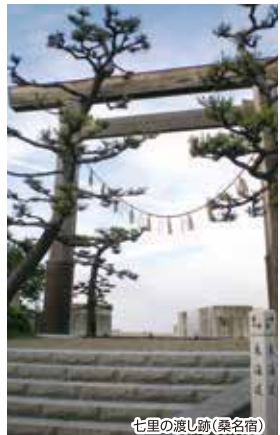
七里の渡し跡(桑名宿)