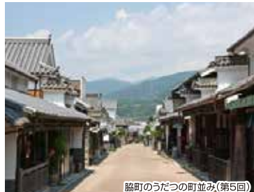
脇町のうだつの町並み(第5回)