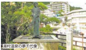
湯村温泉の夢千代像

■行程 各地=浜坂(旧市街地、近世の町並み)・源泉塔・浜坂県民サンビーチ(昼食)・新温泉町山陰海岸ジオパーク館・矢城ヶ鼻灯台・加藤文太郎記念碑・城山園地・諸寄港・諸寄席トンネル=湯村温泉(夢千代の里の散策と、外湯入浴(各自))=各地