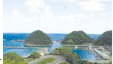
七坂八峠から居組を見下ろす

■行程 各地=穴見海岸展望所・居組・七坂八峠展望台(兵庫・鳥取県境)・陸上(くがみ)洞門・東浜・西脇海岸=岩井温泉(入浴、入浴料各自負担)=各地