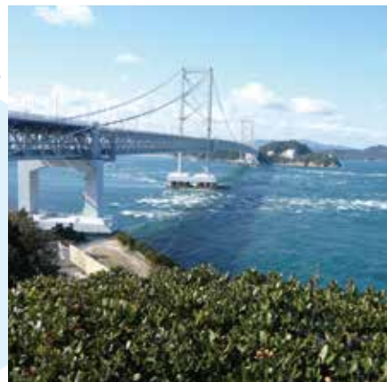
大鳴門橋と鳴門の渦潮