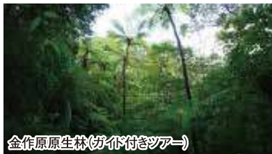
金作原原生林(ガイド付きツアー)