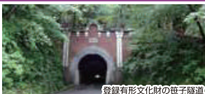
登録有形文化財の笹子隧道