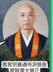
真言宗善通寺派管長 菅智潤大僧正

善通寺は、弘法大師・空海さまの御誕生所であり、高野山・東寺と共に、弘法大師三大霊跡の一つに数えられております。お遍路・朝勤行・境内巡りで真言密教の世界を体験していただきたいと願っております