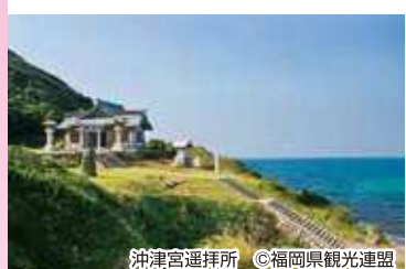
沖津宮選拝所