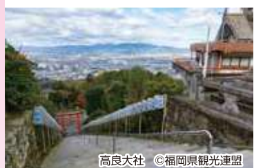
高良大社