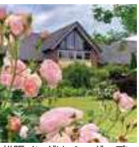
松阪イングリッシュガーデン