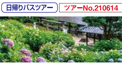
吉備津神社あじさい園