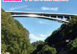
天龍峡大橋の車道の下に設けられた歩道からは眺下に天竜川や川下り、線路を通る鉄道が見え抜群の景色が楽しめます。