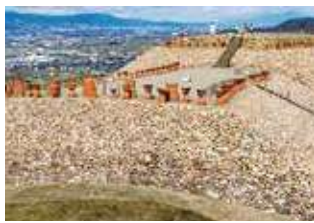
森將軍塚古墳 長野県最大の古墳。ここからの眺望も魅力。