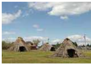
平出遺跡 日本三大遺跡と言われ、縄文から平安まで集落があった。