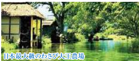
日本最大級のわさび大玉農場

長野県の遺跡総数は12000ヶ所を超え全国でも五指に。旧石器時代、縄文時代の遺跡も多数。各博物館では遺跡から出土した土偶や土器など貴重な資料をご見学頂きます。