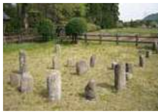
上原遺跡(わっぱいせき) 縄文時代のストーンサークル