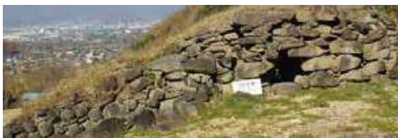
謎の大室古墳群—積石塚とは? (バスは通行不可。) 土ではなく石を積み上げて墳丘を作る高句麗との関連も指摘。

■ご案内 ■添乗員:同行(バスガイド乗務致します) ■最少催行人員:15名 *戸隠神社・五社めぐりは健脚向きです。歩行距離・約6km。