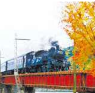
写真撮影と乗車と、双方楽しめます。