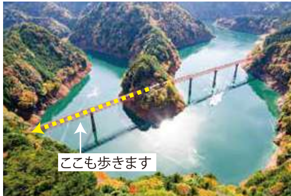
日本で唯一のアプト式鉄道にも乗車