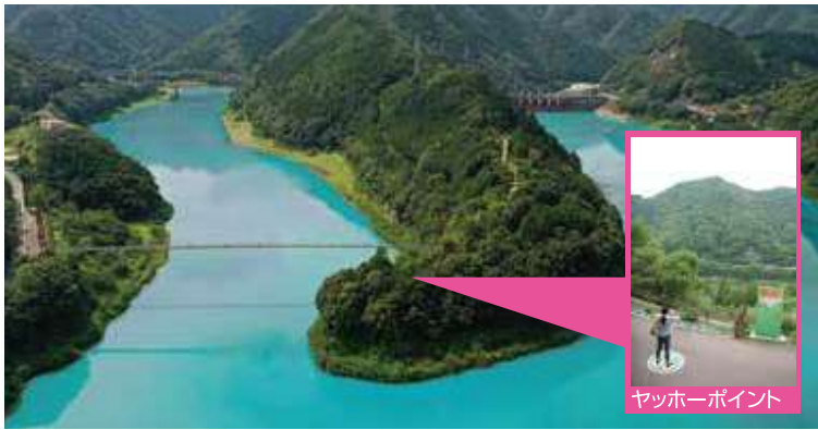
ヤッホーポイント

誰もが山登りの際、一度は頂上から「ヤッホー」と叫んだことがあるでしょう。その山彦が日本一きれいに返ってくると言われる場所が「日本一のヤッホーポイント」です。数々のメディアに取り上げられてきた「ヤッホーポイント」は大人も童心に返る程の楽しいやまびこスポットです。