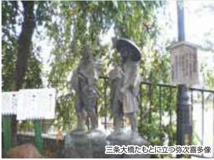
三条大橋たもとに立つ弥次喜多像

京の都から歩き出した東海道。滋賀県近江の国と三重県伊勢国との境には、難所として知られた鈴鹿峠があります。そして関宿へ。重要伝統的建造物群保存地区に指定された町並みは、東海道中でも屈指の風情を残します。歴史の香りを楽しみながら進みましょう。