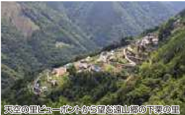
天空の里ビューポイントから望む遠山郷の下栗の里

下栗の里は、南アルプスを望む飯田市上村の東面傾斜面にある標高800m～1,000mの地区です。最大傾斜38度の傾斜面に点在する耕地や家屋は、遠山郷を代表する景観を作りあげています。平成21年には「にほんの里100選」にも選ばれました。景観の美しさ、自然と暮らしの調和、こうした姿がオーストリア・チロル地方に似ていることから「日本のチロル」とも呼ばれています。南アルプスを望む景観はすばらしく、百名山登山家深田久弥氏も、自らの著書で「下栗ほど美しく平和な山村を私はほかに知らない」と絶賛しています。